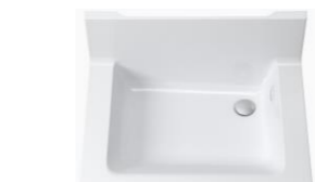
洗面ボウル一体カウンター(実容量12L)