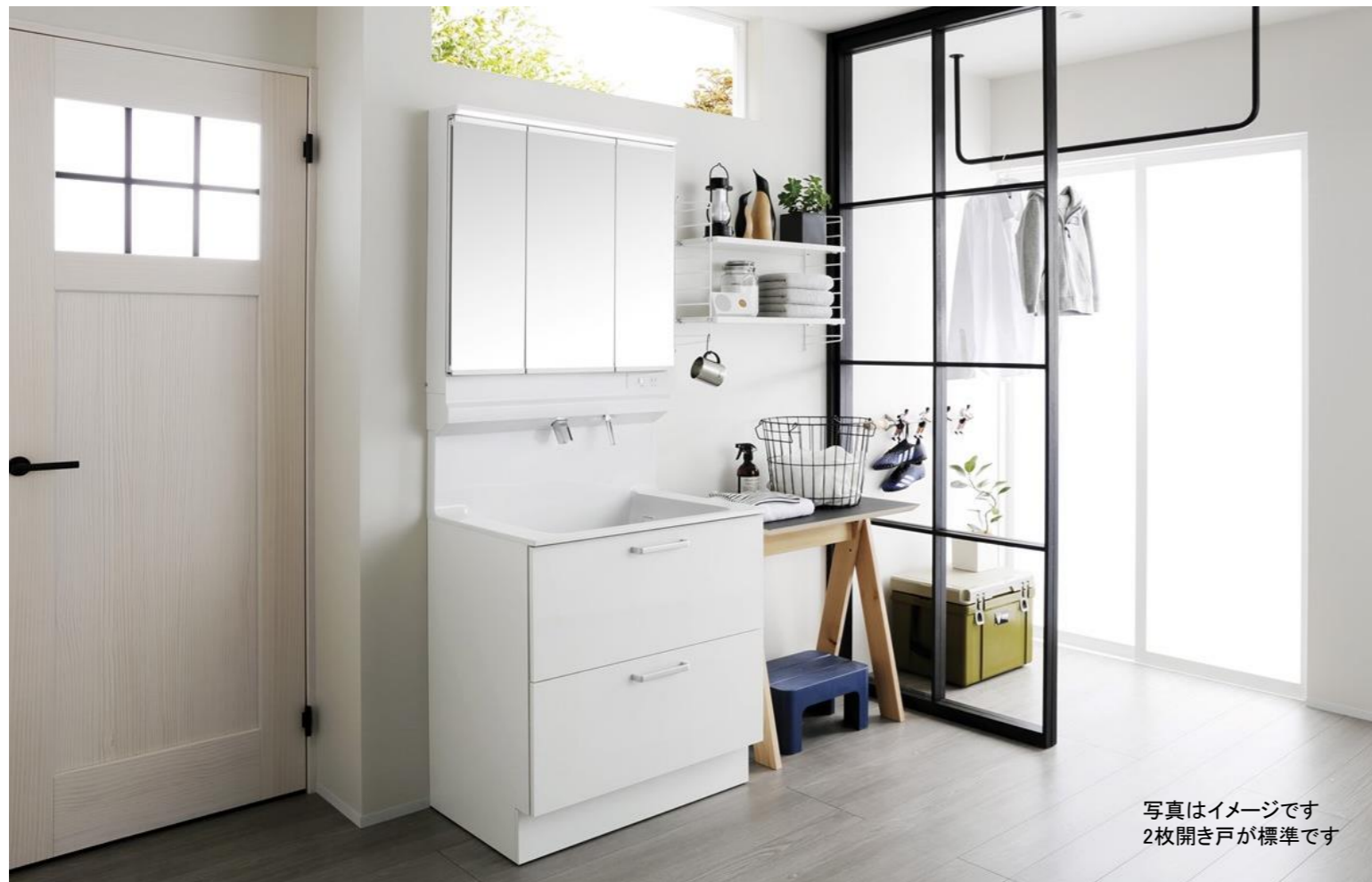
写真はイメージです 2枚開き戸が標準です