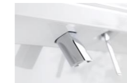
お掃除ラクラク水栓