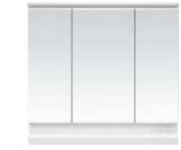
三面鏡・ワイドLED照明 (間口750mm)エコーあり